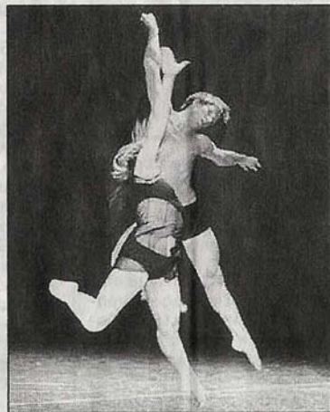
La danza ha aperto il Piccolo festival